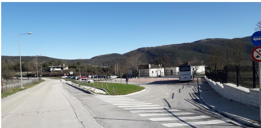
Εικόνα 10: επέκταση του χώρου στάθμευσης του αρχαιολογικού χώρου (2023)