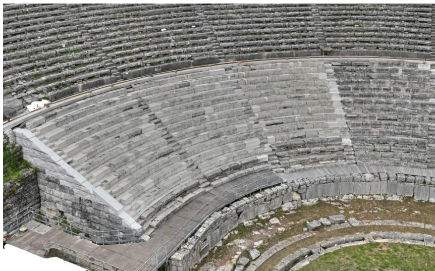
Εικόνα 6: Ολοκλήρωση της αποκατάστασης της κατώτερης ζώνης του κοίλου του αρχαίου θεάτρου (2022)