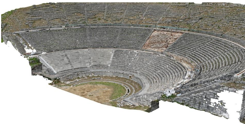
Εικόνα 7: Ολοκλήρωση της αποκατάστασης της κατώτερης ζώνης του κοίλου του αρχαίου θεάτρου (2022)