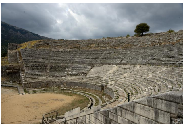
Εικόνα 3: Αποκατάσταση των κερκίδων 1-6 της κάτω ζώνης του θεάτρου (2015)