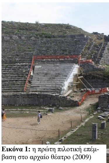
Εικόνα 1: η πρώτη πιλοτική επέμβαση στο αρχαίο θέατρο (2009)