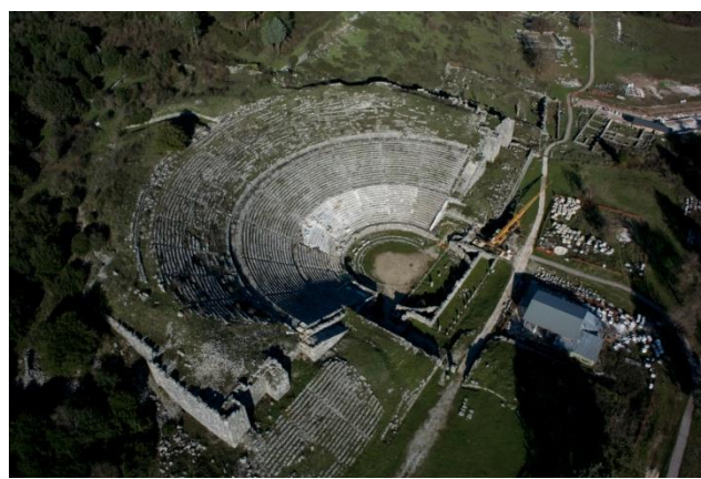
Εικόνα 4: Αποκατάσταση των κερκίδων 1-6 της κάτω ζώνης του θεάτρου (2015)