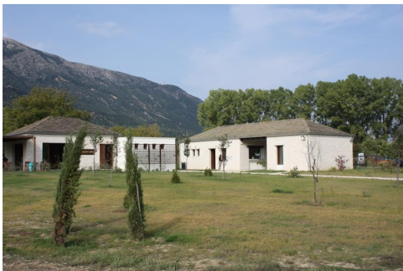
Εικόνα 2: νεότερες υποδομές εξυπηρέτησης κοινού (2006)