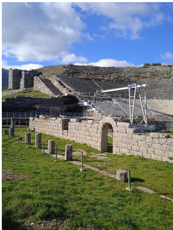
Εικόνα 9: τοποθέτηση μηχανισμού γερανογέφυρας επί του κοίλου (2021)