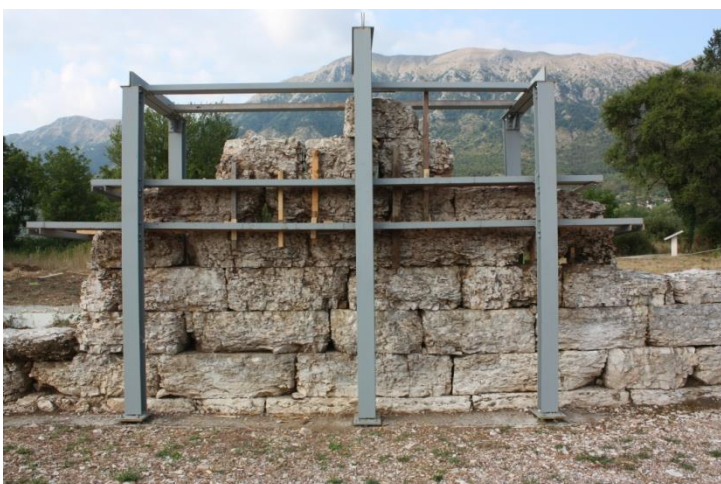
Εικόνα 5: Στερέωση αποκατάσταση της τοιχοποιίας της δυτικής στοάς του Ιερού